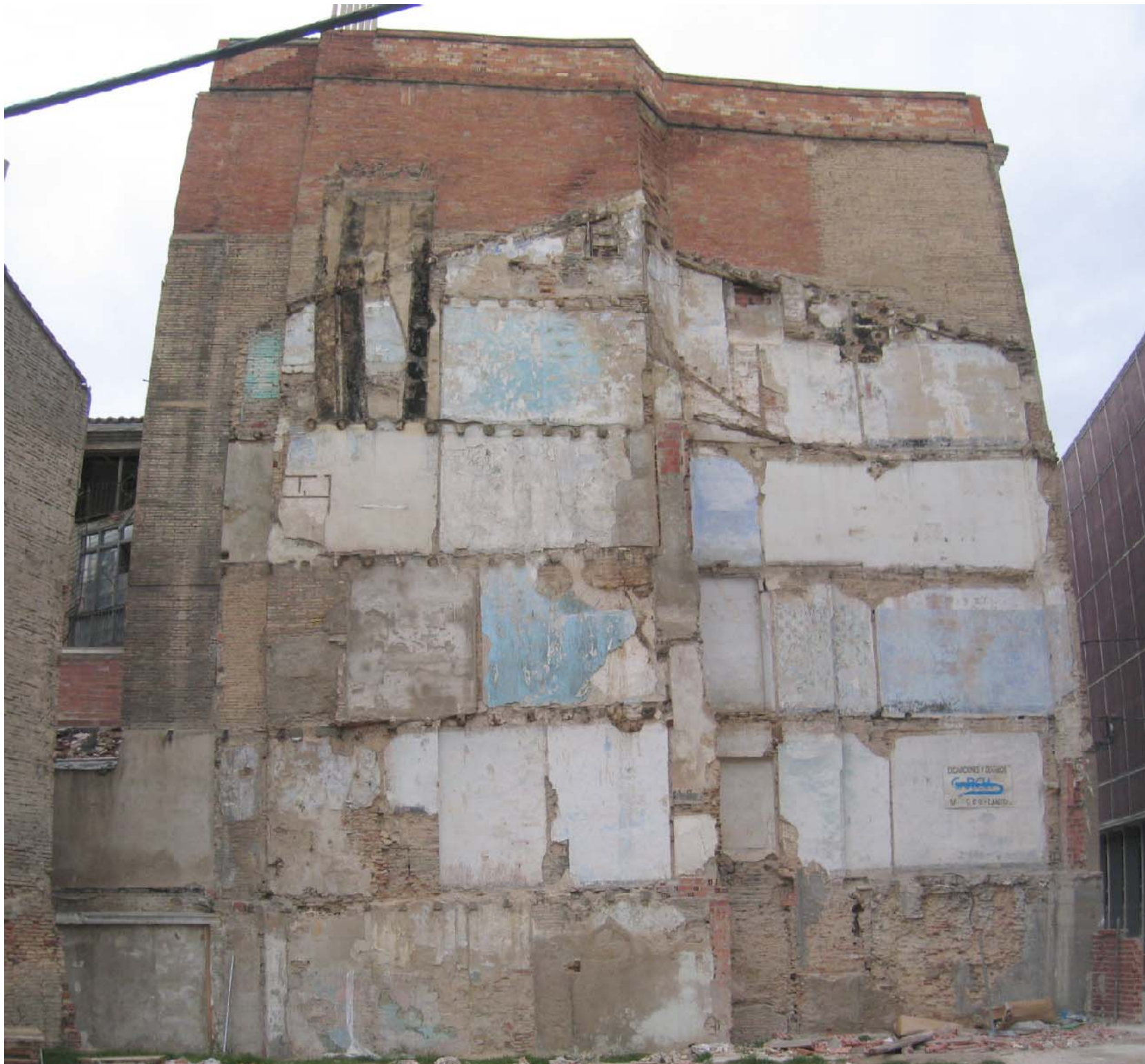
MEDIANERA HACIA LA CALLE MORATA