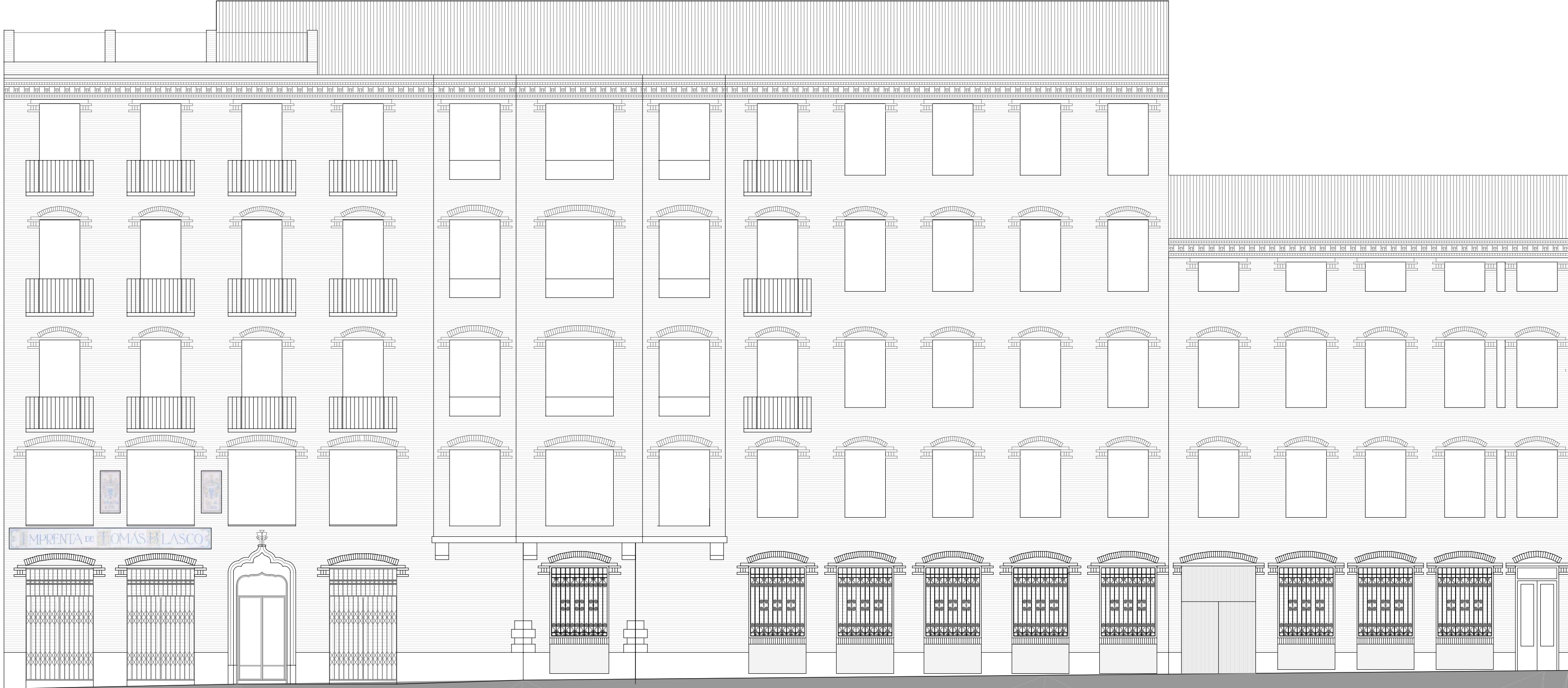
ALZADO PLAZA ECCE HOMO